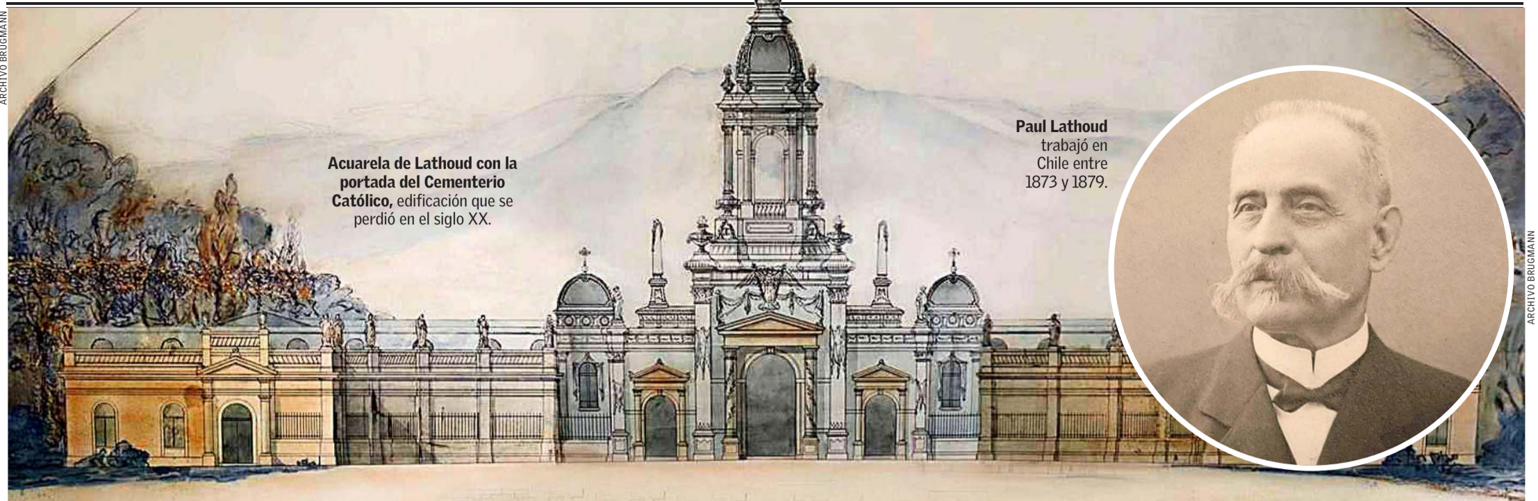
Acuarela de Lathoud con la portada del Cementerio Católico, edificación que se perdió en el siglo XX.